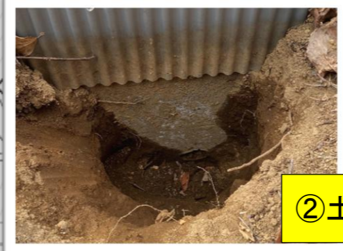
② 土砂除去・砕石埋め戻し