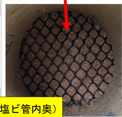
① フィルター装着(塩ビ管内奥)